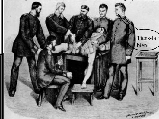
Figure 1. La dissection de la Belgique